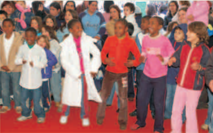
Jovens participam activamente em workshop de dança por ocasião da inauguração do Centro de Inovação Comunitária da Alta de Lisboa

Procura-se que os Centros tenham uma gestão participada e que, após o final do K'CIDADE, o seu funcionamento venha a ser assegurado pela comunidade (grupo de moradores e/ou de organizações locais).