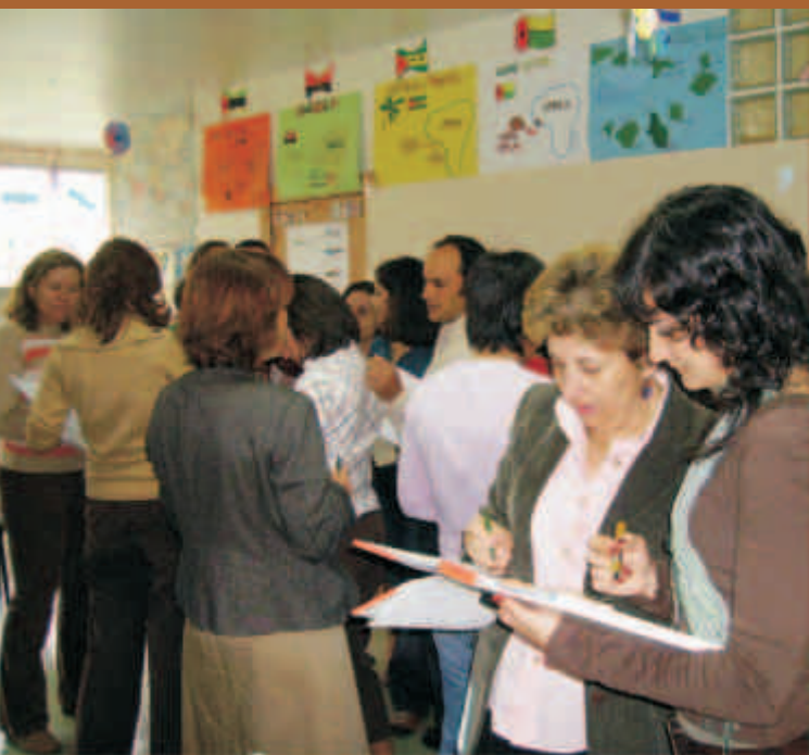
Sessão temática sobre educação, com parceiros locais da Ameixoeira

O Programa tem assumido a função de facilitador de redes de parceria locais, no sentido de promover o desenvolvimento integrado e a dinamização de novas formas de planeamento e intervenção comunitária, mobilizando actores do sector privado e público, promovendo o envolvimento dos residentes e procurando realizar um trabalho conjunto de reflexão e acção territorial, visando a alavancagem de oportunidades e a resposta aos problemas locais.