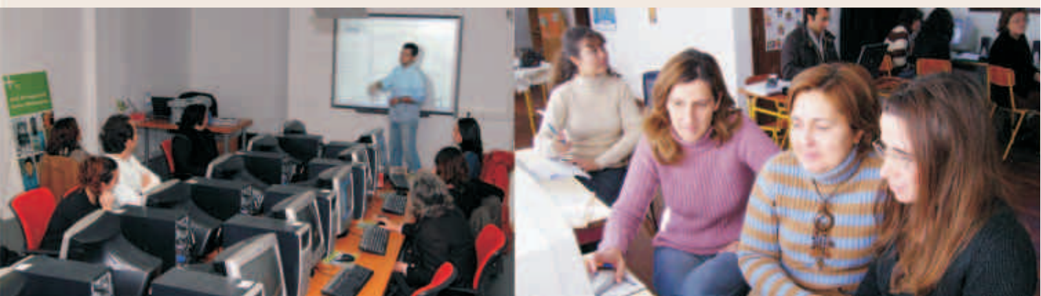
Sessões de formação em TIC