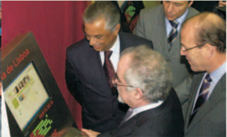
Ministro do Trabalho e da Segurança Social, Presidente da Câmara de Lisboa e Presidente da Fundação Aga Khan Portugal consultam o site do K'CIDADE, por ocasião da inauguração do Centro de Inovação Comunitária da Alta de Lisboa em Março de 2006