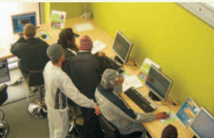
Espaço de Inclusão Digital na Alta de Lisboa