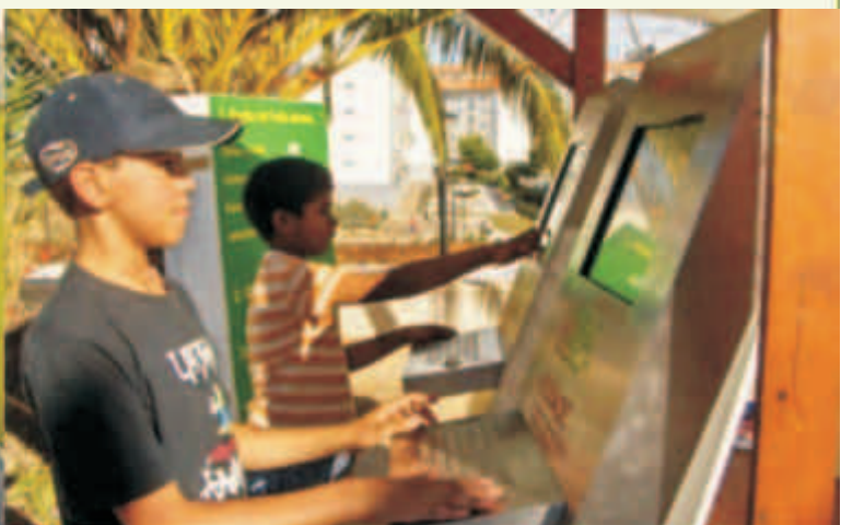
Jovens consultam quiosque digital no lançamento do Guia de Recursos em Mira Sintra