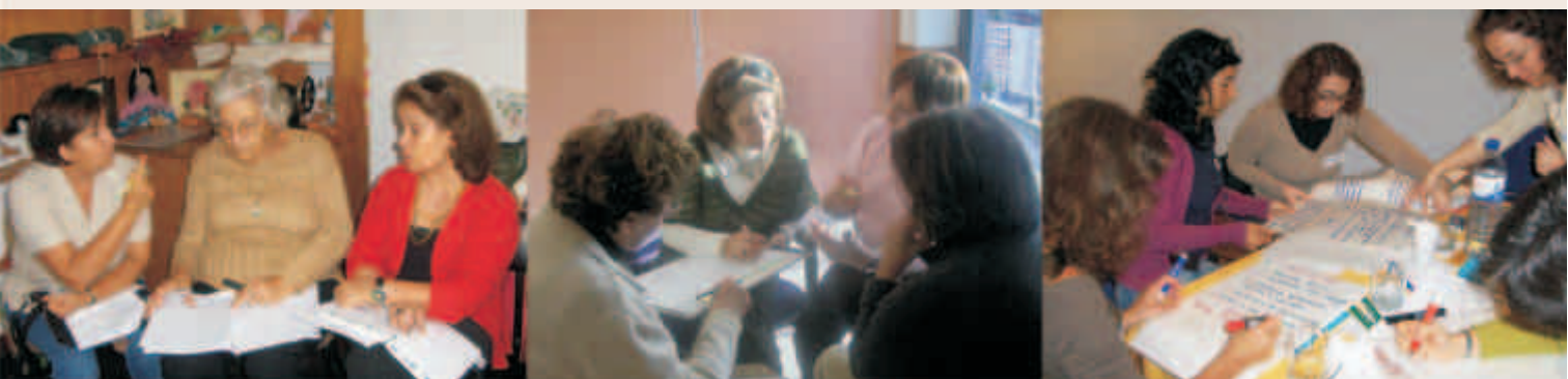
Membros da Direcção da ARPIMS definem a visão, missão e objectivos estratégicos para a organização

Estes processos poderão passar por metodologias mais formais ou informais, que incluem a realização de auto-diagnósticos organizacionais, a definição de planos estratégicos (clarificação e/ou redefinição da Missão, Visão e Objectivos da Organização), consultoria em áreas específicas da organização (de gestão ou de melhoria dos serviços prestados), acompanhamento das acções de melhoria definidas, desenvolvimento de formações à medida ou acções de formação para grupos de organizações.