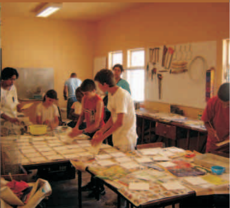
Organizações da Alta de Lisboa participam e envolvem os seus beneficiários na construção de um Mural sob o tema “Eu e o meu bairro”